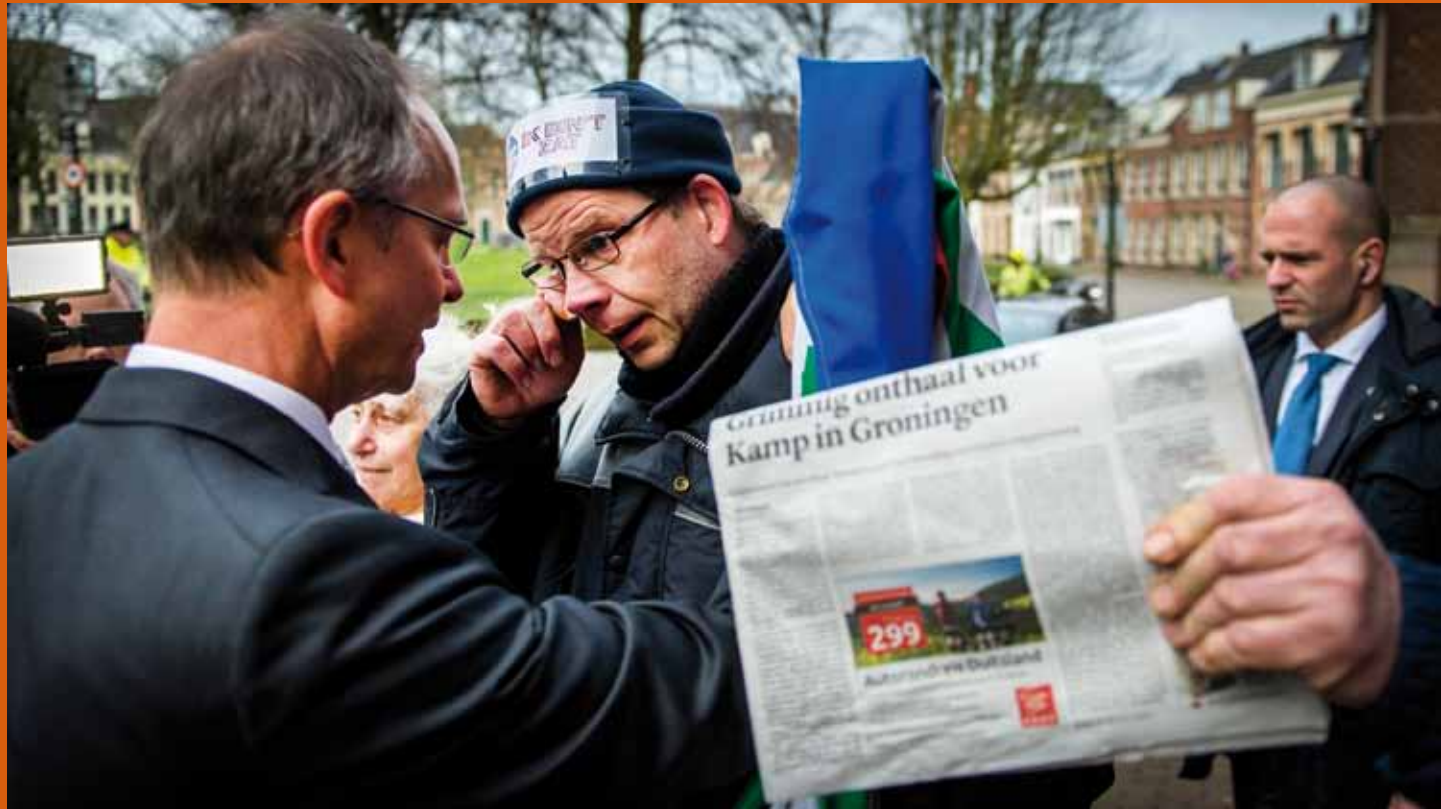
Minister Kamp van Economische Zaken gaat in gesprek met gedupeerden van de aardgaswinning in Groningen, januari 2014 (Remko de Waal/ANP).