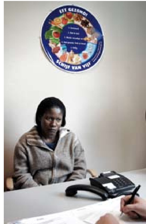
Afrikaanse vrouw op het spreekuur van de MOA, de Medische Opvang Asielzoekers. AZC Alkmaar 2006.