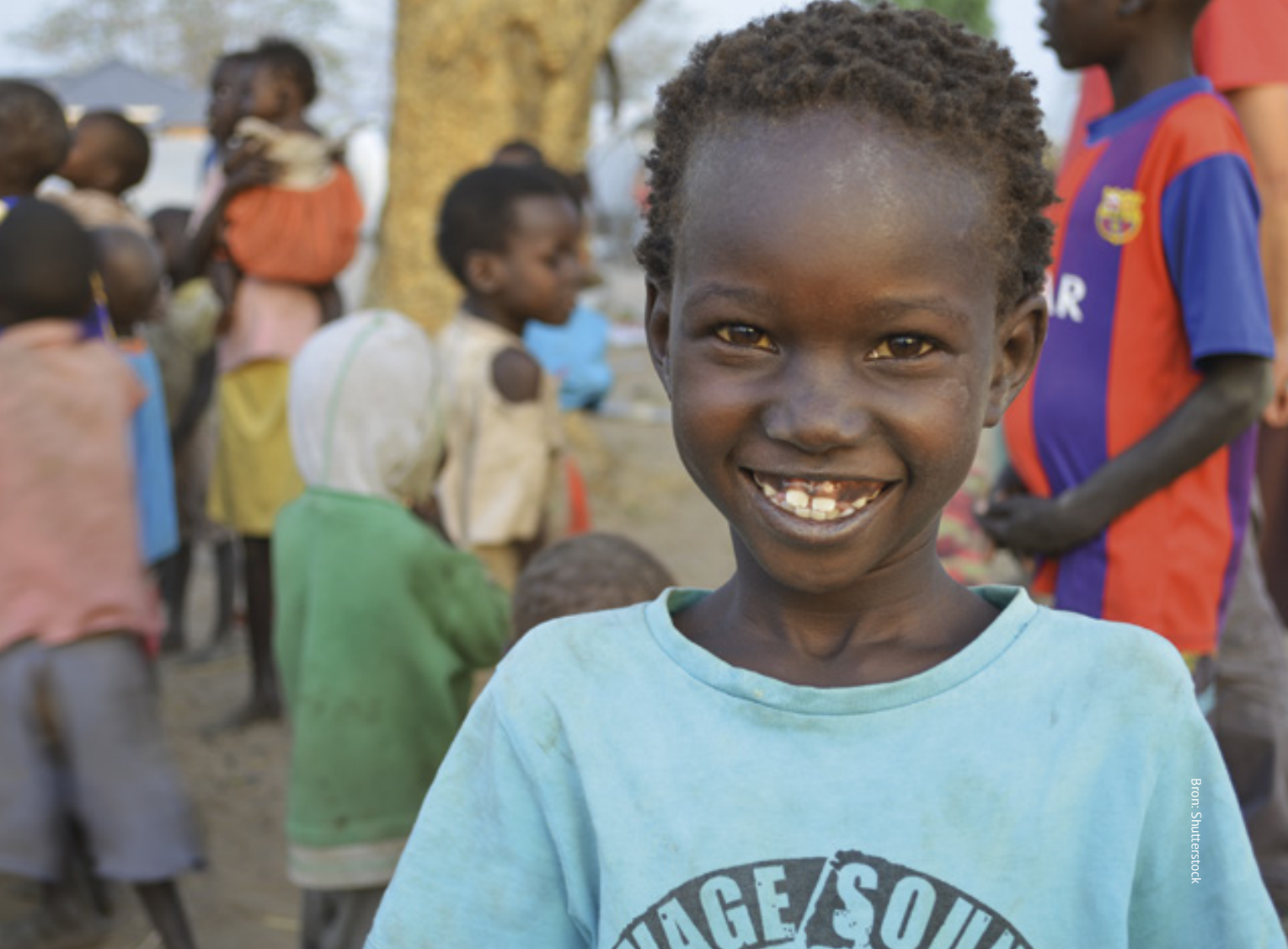
Vluchtelingenkamp in Zuid-Sudan, 2017

tal Health and Psychosocial Support in Conflict Affected Areas is inmiddels een online tijdschrift dat tot op heden twee keer per jaar gepubliceerd wordt.