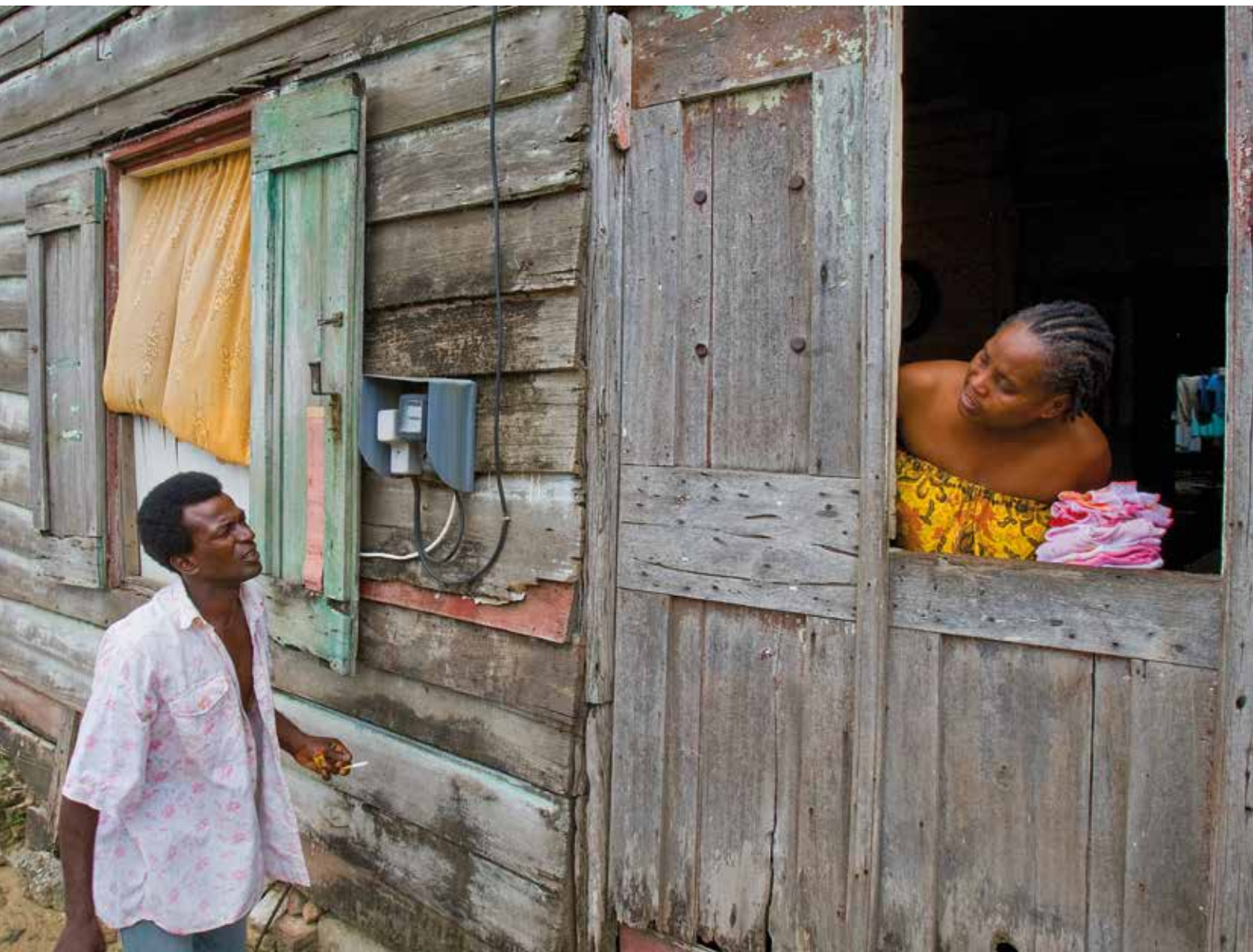
Het huis van Anton de Kom in Paramaribo.