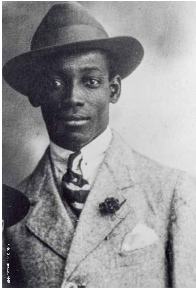
Anton de Kom