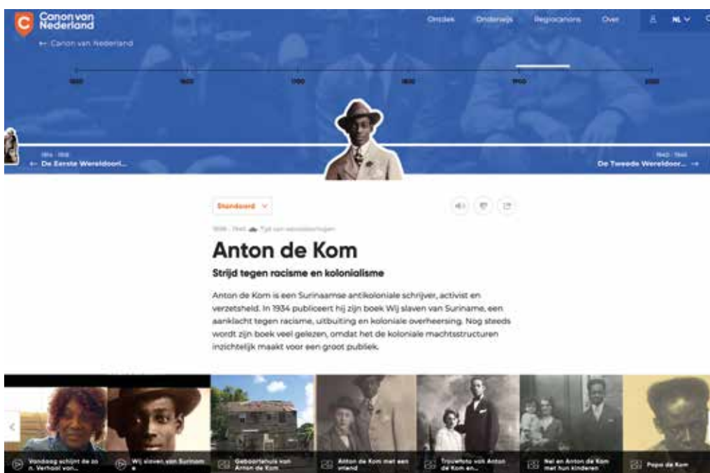
Anton de Kom in de Canon van Nederland ( www.canonvannederland.nl/nl/antondekom ).

De roep om een inclusievere en meerstemmige geschiedenis kan ik volledig onderschrijven. En toch voelde ik mij als Nederlandse, witte, historicus en man, terughoudend of misschien zelfs gediskwalificeerd om over De Kom te schrijven. Hoe kon ik deze geschiedenis beschouwen, zonder die me toe te eigenen? Dat vroeg en vraagt inlevingsvermogen van mijn kant. Ik moet de