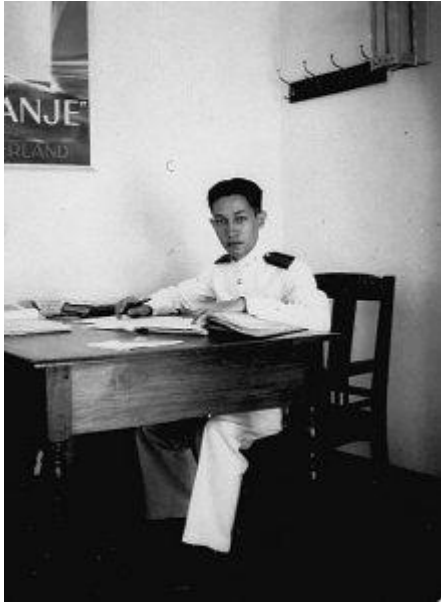
De Leeuw op herhalingsoefening, 1941.

Ed was niet betrokken bij verzet. Tegen wie zou je je eigenlijk moeten verzetten?, verzuchtte hij later eens. Maar hij durfde zich al direct niet meer op straat te vertonen. Als het toch moest, ging hij verkleed in de sarong en kebaja van zijn zusje. Hij was jong, tener gebouwd en Indo, en dat heeft hem wel een paar keer gered. In de periode tussen 10 maart 1942 en eind augustus 1945 had Ed vier onderduikadressen. Binnen twee maanden moest hij zijn eerste schuilplek al opgeven, omdat verraad dreigde. Hij ging tegen betaling wonen bij F., die zijn uniform had weggegooid.