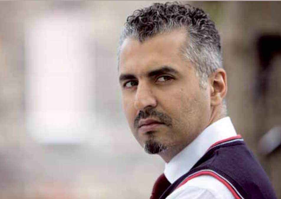
Maajid Nawaz

Op 28 maart 2015 sprak Maajid Nawaz in De Rode Hoed te Amsterdam de Socrateslezing 'From extremism to secular liberalism' uit. De belangrijkste vraag die hij, als ervaringsdeskundige, opwierp was: hoe kunnen wij als vrijgevochten westerlingen met een sterk geïndividualiseerde cultuur een inspirerend alternatief bieden voor het zoveel Islamitische jongeren aansprekende islamisme? Jurriaan Jacobs verkent hoe Nawaz deze vitale vraag beantwoordt. Bieden democratische 'counter-narratives' die aanhaken op de kernelementen van islamisme misschien adequaat weerwoord?