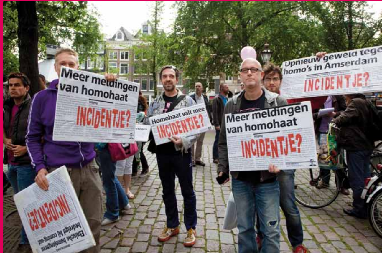
Betoging tegen homogeweld, Amsterdam 2010