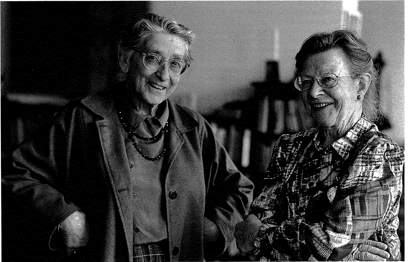
Pooh en Piglet

Nauwgezetheid is weer een kenmerk. Het aantal cellen, de oppervlakte, de werking van het raam, de plaats van het luchtgat waardoor men contact met elkaar kon houden ('Je kende iedereen bij stem'), alles wordt precies vermeld. Voor de mannen betekende het verblijf in de bunker wachten op de dood. In de maand augustus 1944 werden meer dan tweehonderdvijftig mannen neergeschoten. Hetty Voûte, die in augustus/september 1944 een tijd in de bunker opgesloten zat, beschrijft de herdenkingsdiensten die er 's avonds voor hen werden gehouden via de buizen van het communicatiesysteem.