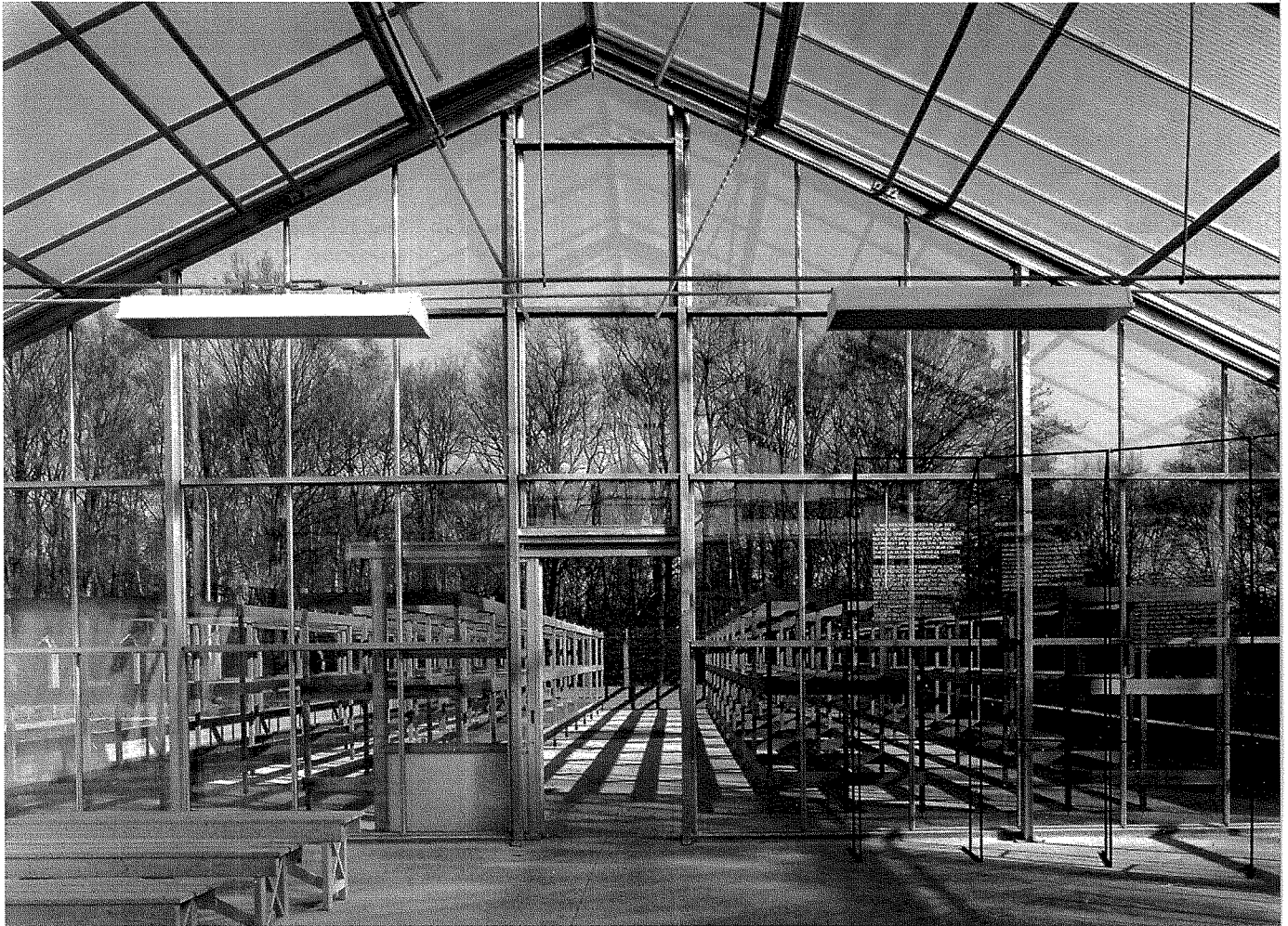
Glazen barak en houten bedden

van pogingen de geschiedenis juist niet symbolisch maar nauwgezet en feitelijk te reconstrueren. Hoe had deze plek eruit gezien, wat was er gebeurd, en wie waren de mensen die het hadden moeten meemaken?