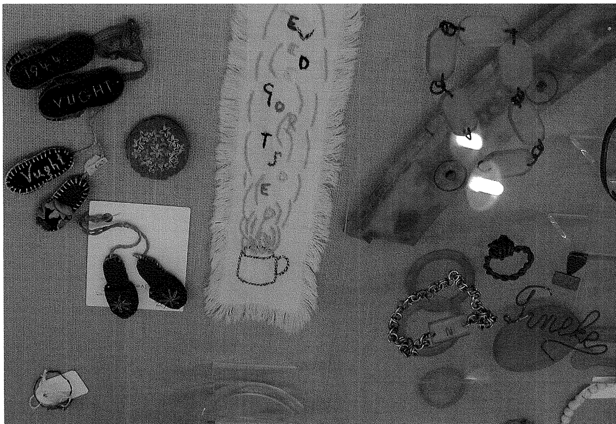
Voorwerpjes Vughts Historisch Museum